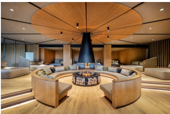
Pierers Plauderei: Der besondere Ort für Begegnung und Kommunikation.