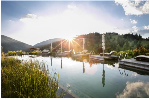
Der Naturschwimmteich mit Almstrand lädt zum Verweilen ein.