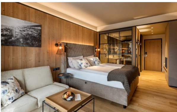
Neu gestaltete Zimmer und Suiten im Almwelness Hotel Pierer.