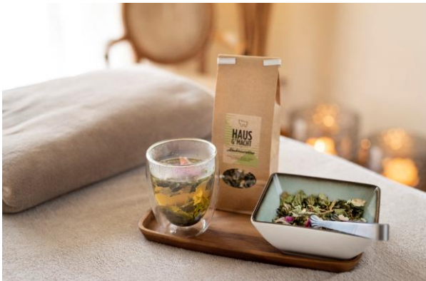
Wohltuender Almkräutertee zum Ausklang des Alm-Rituals.