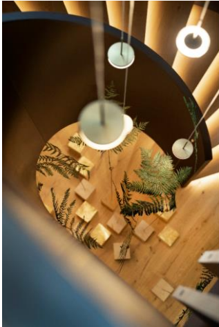
Wunderschöne Einblicke in die neuen Räumlichkeiten im Almwelness Hotel Pierer.