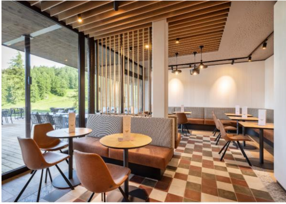
Stilvoll und kultig: Pierers Milchbar im Retrolook mit großartigen Snacks und Shakes