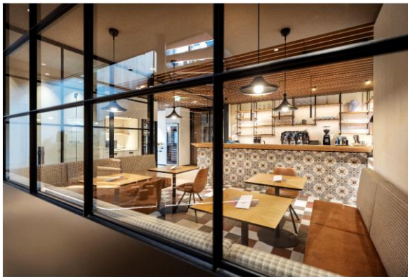
Kunstvolles Interieur im neuen geschmackvollen Bistro: Pierers Milchbar