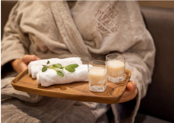
Das exklusive Alm-Ritual ist als besondere Aufmerksamkeit Teil jeder Wellness-Behandlung.