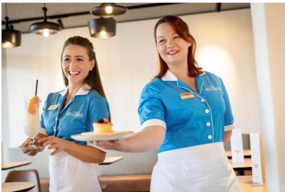
Herzlich Willkommen in Pierers Milchbar!