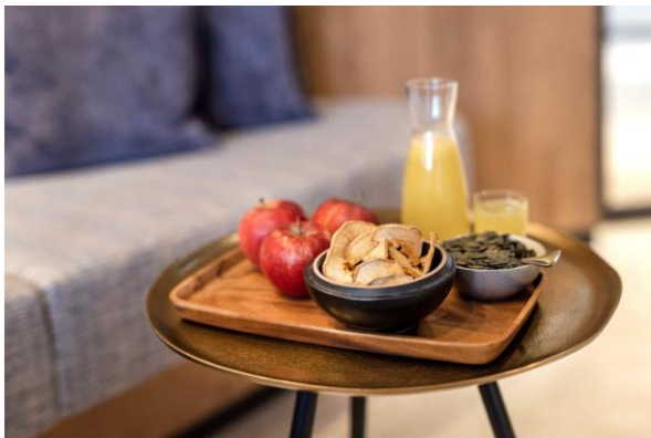
Frische Almsnacks stehen jederzeit in der Wellnessabteilung bereit.