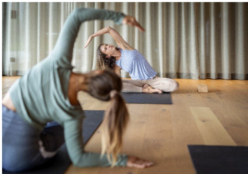
Täglich wechselndes Aktivprogramm