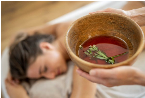
Almwellness mit der Kraft der Almkräuter