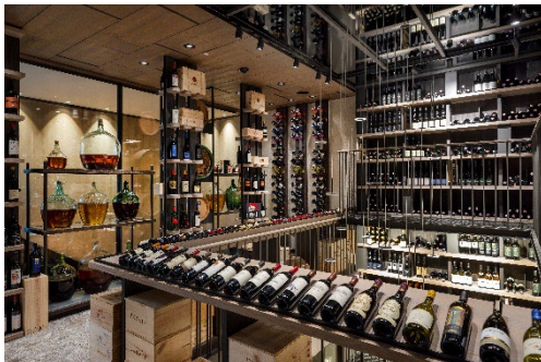
Spektakulärer, dreigeschossiger Weintresor mit bis zu 8.000 Flaschen